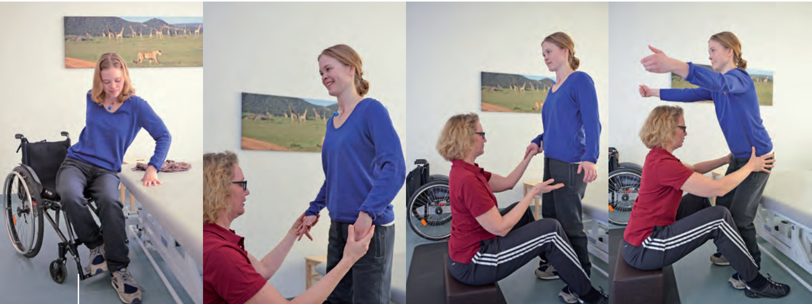
Im Training werden Nervenzellen neu strukturiert, die Wahrnehmung und Koordination verbessert und die körpereigene Muskelsteuerung gesteigert. Verloren gegangene Fähigkeiten, etwa in der Motorik, können wiedererlernt werden.

verbringt. „Ich war schon immer ein Kämpfertyp und gern sportlich aktiv. Ich liebe es, in Bewegung zu sein, und verspüre einen unbändigen Drang, alles nachzuholen, was ich an Sport und Motorik in den letzten Jahren verpasst habe.“ Außerdem sei es jedes Mal ein ganz unbeschreibliches Glücksgefühl, ein klein wenig beweglicher zu sein als noch vor einem Monat, einer Woche oder nur vor einem Tag.