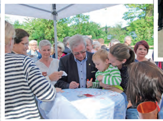
Mitarbeiter und Anwohner verewigten sich mit einem Fingerabdruck und ihrer Unterschrift auf dem Banner, das mit in die Kapsel gelegt wurde.