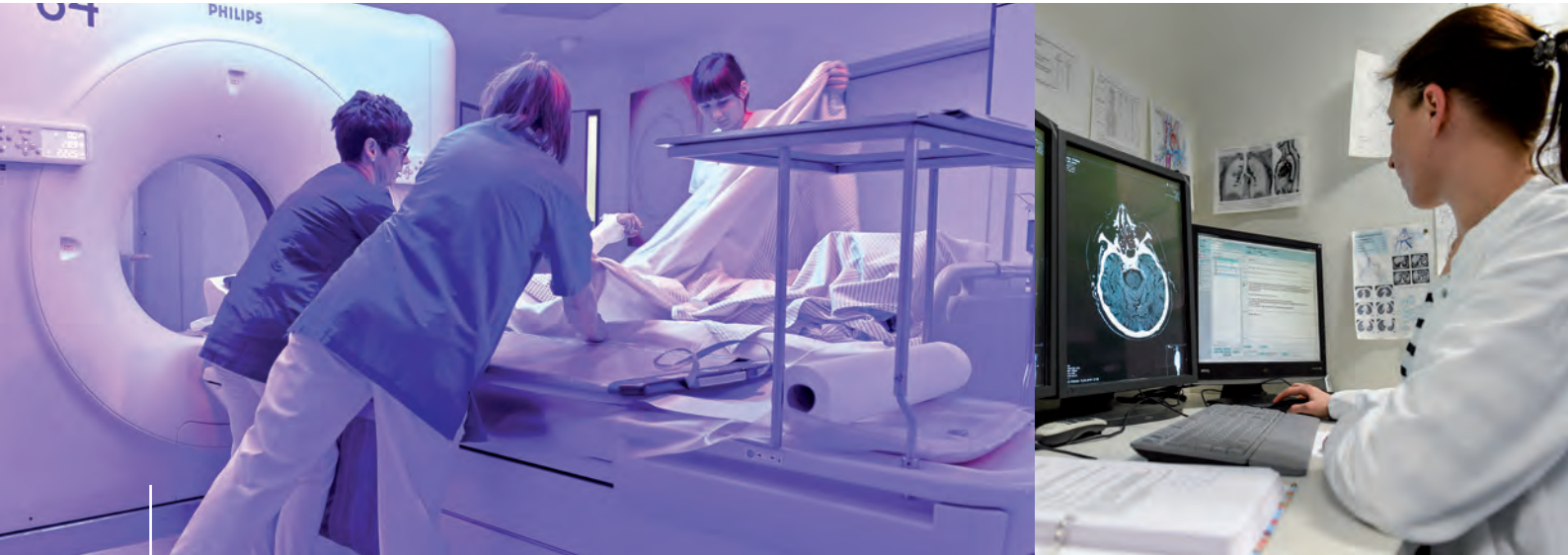
Rund um die Uhr verfügbar: Für detaillierte Untersuchungen stehen Geräte wie der Computertomograf bereit.

mehrere Stunden dauern könne – bei niedergelassenen Fachärzten wären diese Untersuchungen eine Aufgabe für etliche Wochen.