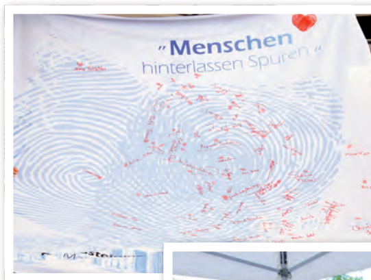
„Menschen hinterlassen Spuren“ lautete das Motto der Grundsteinlegung in Distelhausen.